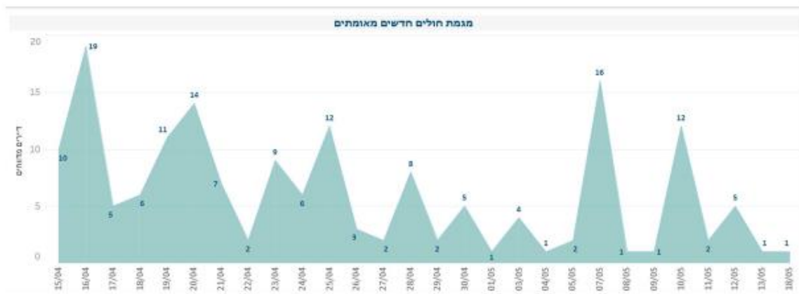
מגמת מטופלים חדשים מאומתים

להלן פירוט אודות מגמת מטופלי חדשים מאומתים בקורונה במוסדות, בין התאריכים 15.4-18.05.